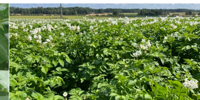
Kukinta ja sen jälkeen